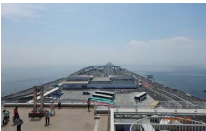
うみほたるから海を臨む

当日は、お天気に恵まれ気温も27℃と夏のような暑さとなりました。往きは南千住から東京湾アクアラインを経由するルートで、途中「うみほたる」で休憩をとりました。