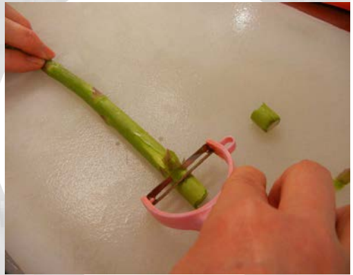
ピーラーなどで根元等をそぎます